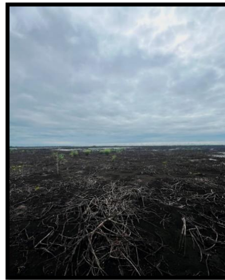
FIGURA 2: Retrato da Estação ecológica de Taiamã, com as cicatrizes do fogo que a atingiu em janeiro de 2024. É observável a vegetação rasteira se reestabelecendo, mas fica o questionamento. Até quando a natureza vai suportar esses eventos climáticos extremos, e será que as árvores terão resiliência suficiente para rebrotarem novamente?

O tempo, de maneira resiliente, atua de forma eficaz para o meio ambiente, onde as árvores rebrotam em locais inóspitos sem compromisso nenhum com aquele que a retirou de lá, assim demonstrando que o ambiente não depende do ser. A resiliência das árvores serve como um lembrete de que, apesar das pressões imediatistas da sociedade, a natureza opera em um ritmo próprio, oferecendo lições valiosas sobre paciência, persistência e renovação. O tempo, aliado à natureza, nos ensina a valorizar e respeitar os processos naturais que sustentam a vida na Terra.